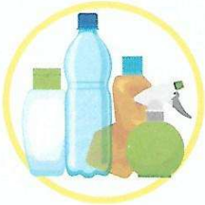
Bouteilles et bidons en plastique

Tous les emballages carton, plastique, métal et les papiers vont dans le bac ou le conteneur jaune.