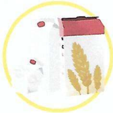
Emballages et briques en carton