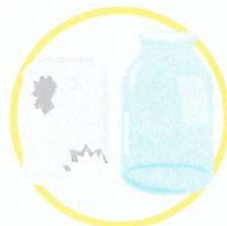
Pots de confiture et bocaux en verre