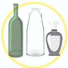
Bouteilles en verre et flacons de parfum

Les bouteilles, pots et bocaux en verre sont à déposer dans le bac ou le conteneur à verre.