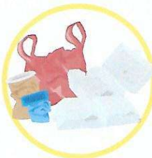
Emballages en plastique et polystyrène