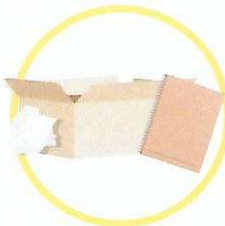
Papiers et cartons